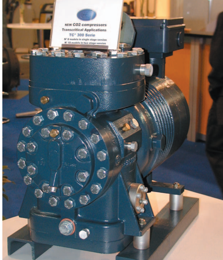
Dorin-compressor voor superkritische compressie van CO 2

Water Kan er een prettiger koudemiddel zijn dan water. Het is onschadelijk voor de ozonlaag, het broeikas effect is minimaal, het is niet brandbaar of giftig en ook nog eens supergoedkoop. Vervelend is alleen dat bij temperaturen boven nul onder vacuüm moet worden gewerkt om water te kunnen verdampen. Dat lukt overigens prima in absorptiekoelmachines. Veel aandacht voor deze bewezen techniek was er niet op de IKK2003. Alleen EAW uit Westenfeld presenteerde een noviteit op dit gebied. De wkk-fabrikant maakt sinds enkele jaren absorptiekoelmachines voor combinaties met gasmotoren. EAW leverde bijvoorbeeld zo'n koelmachine aan Deutsche Telekom voor een combinatie met een brandstofcel van 250 kilowatt. Nu heeft men ook een minikoelmachine met een koelcapaciteit van slechts vijftien kilowatt. Een eerste