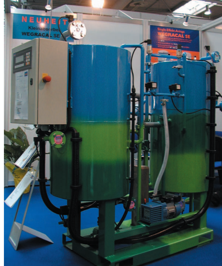
Mini-absorptiekoelmachine voor gebruik met zonnecollector

De Oostenrijkse compressorfabrikant Frigopol bouwt een unieke semi-hermetische compressor die ook geschikt is voor ammoniak als koudemiddel. Deze compressoren hebben een speciaal scheidingsschot dat voorkomt dat de motorwikkelingen met het koudemiddel in aanraking komen. Naast ammoniak ofwel R717 gebruikt Frigopol ook R723. Dit is een azeotroop mengsel van ammoniak en dimethylether. De voordelen zijn hogere capaciteit, lager energieverbruik, lagere eindtemperatuur van het gas uit de compressor en betere eigenschappen ten aanzien van smeerolie. Ten opzichte van het al gunstige ammoniak kan een besparing op energieverbruik van circa zeven procent worden bereikt. De voorzorgsmaatregelen voor dit koudemiddel zijn echter nog belangrijker dan bij ammoniak, omdat dit mengsel brandbaarder is.